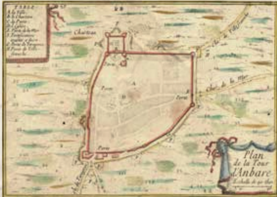
Plànol de Torredembarra...realitzat el segle XVII pel Cavalier de Beaulieu, enginyer militar al servei de Lluís XIV de França. El castell ocupava l'angle de la muralla i n'era el principal baluart

És considerat un dels membres més destacats de la nissaga i va consolidar el paper de la família en l'àmbit polític i social. Va morir a Tarragona i va ser enterrat a la capella de Sant Jordi de l'església de Torredembarra, també coneguda com la "capella dels senyors".